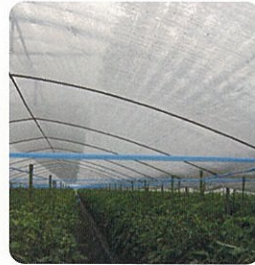
練込みタイプは持久力がありません。