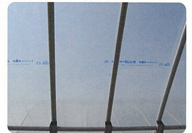
エクストラは持続安定性に優れた流滴剤をコーティングしています。