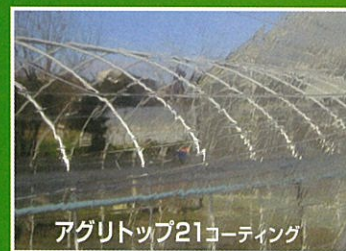
アグリトップ21コーティング